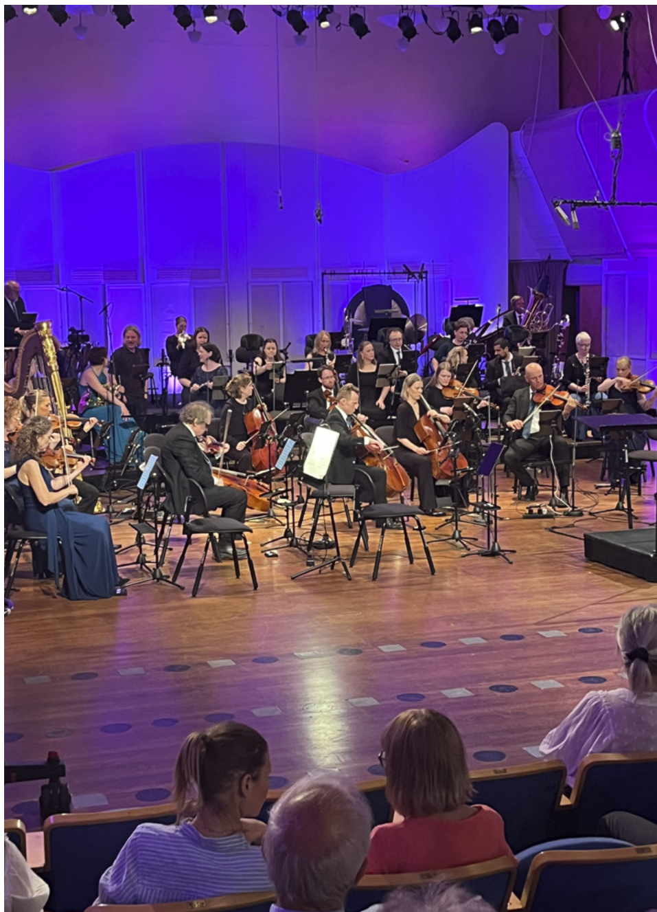
KORK i Store Studio.

NRK – eller Norsk Rikskringkasting på Marienlyst – ligger helt nord-vest i bydel St.Hanshaugen. I november 2023 var historielaget på besøk i det gamle erverdige radiohuset. I Store Studio fikk vi en presentasjon av KORK – Kringkastingsorkesterets mer enn 75-årige historie. Vår guide og foredragsholder har skrevet et utdrag av fortellingen som vi deler her.