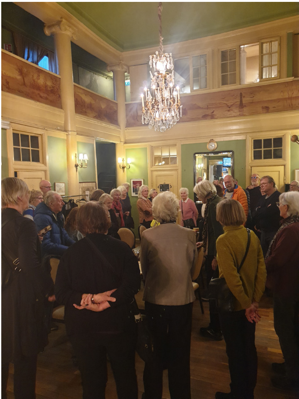
Historielaget på besøk i søylehallen i Centralteateret.