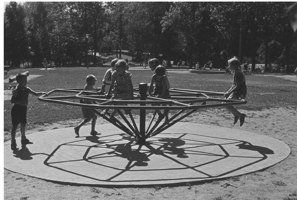
Barn i lek på karusell.

Det beste vårtegnet var når snøen smeltet, og vi kunne gå med sko. I gatene hoppet vi med slengtau og vanlig hoppetau, det var genialt fordi det kunne brukes både alene og sammen, og vi tok Frydenlundgaten i bruk. Vi slang og hoppet etter tur og sang «Bamse bamse, ta i bakken. Bamse bamse, snu deg om. Bamse bamse vend tilbake, samme veien som du