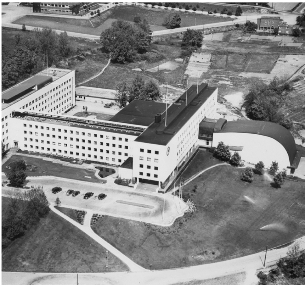
NRK-radiohuset på 1950-tallet, før TV-huset ble bygget.