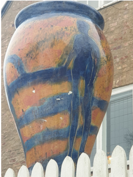
Keramikkrukke som står utenfor Widerbergs hus

i kjelleren i Pilestredet har de funnet flere tusen kunstverk, som de nå fotografierer og katalogiserer. Frans hadde alltid vanskelig for å kvitte seg med kunsten sin, høyst motvillig kunne han selge noen av sine bilder.