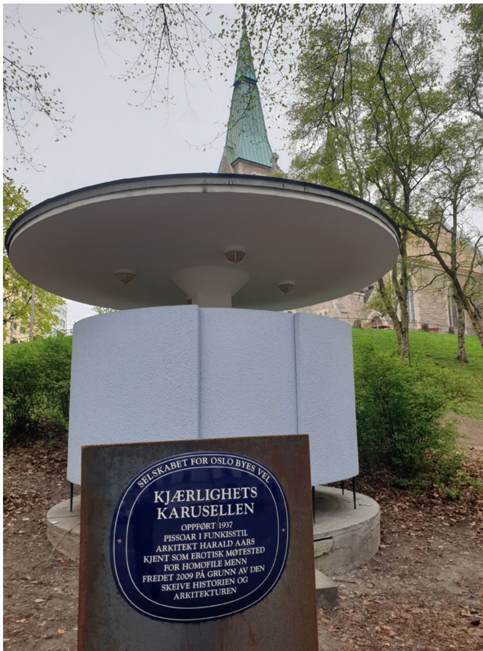
Nytt blått skilt i Stensparken.

«Kjærlighetskarusellen», «Lykkehjulet», «Paraplyen», kjært barn har mange navn. Pissoaret i Stensparken har endelig fått blått skilt.