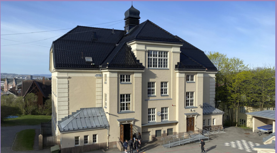
Denne skolebygningen var ny i 1913

Ullevålsveien skole har feiret sitt 125-års jubileum. Dette er en spesialscole for elever fra hele byen. Skolen startet opp i 1898, i hovedhuset på gården, en av de eldste løkkegårdene. På bildet ses «nybygget» fra 1913. På det meste var det 200 elever her, i dag er det 54.