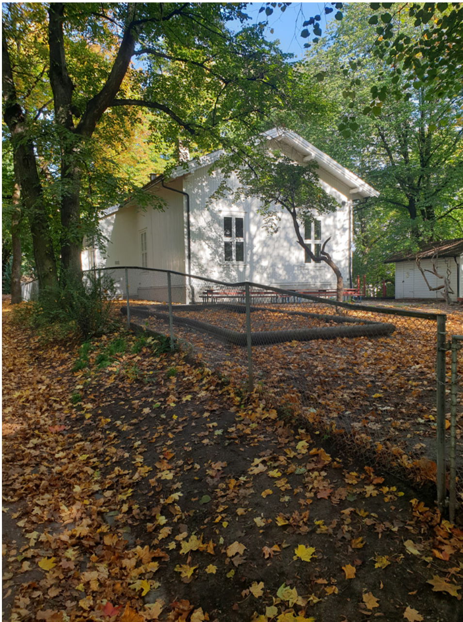
Barnehagen på St. Hanshaugen.