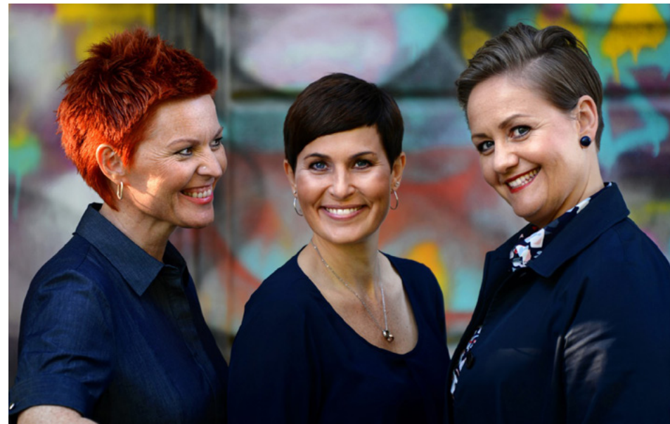
Trio Mediæval.

med Oslo Internasjonale Kvinnekor. Det er organisert som en stiftelse, og består av 40 damer fra 20 forskjellige land. Det er virkelig inspirerende. Vi møtes hver uke i Forandringshuset på Grønland, og øver på folkemusikk fra deltakernes hjemland. Det blir jo både voksenopplæring og språkopplæring i musisk innpakning. Noen konserter blir det også, og de er gratis.